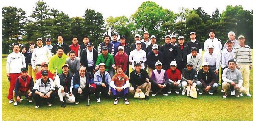
熊本東南RC 30周年記念コンペ (2014. 4. 20) 於 熊本中央GC

熊本東南ロータリークラブ 創立30周年記念コンペ 日時：4月20日(日) 場所：熊本中央GC 参加者：当クラブ11名