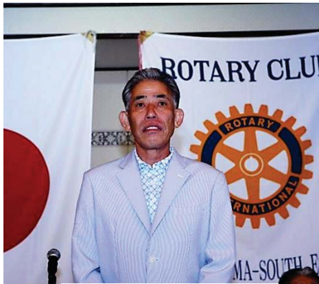
小林会員よりご挨拶