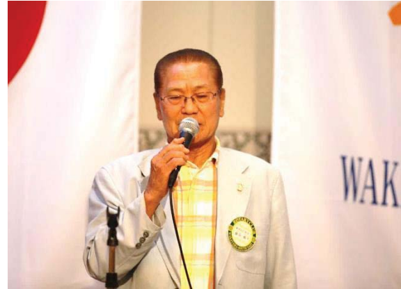
釜中 甫干 職業奉仕委員長