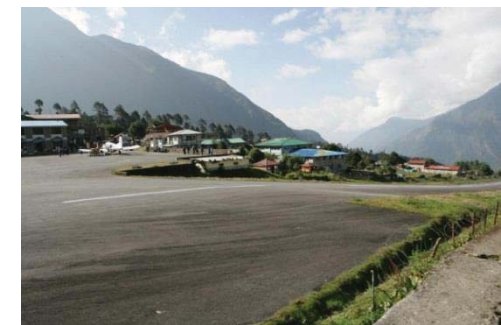
ルクラの空港、世界中で一番危険な空港!!! 年間2機墜落するそうなの(・・;)