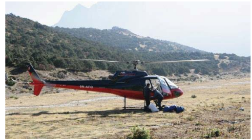
その飛行場跡にこれから乗るヘリがやってきた（大汗!!!）