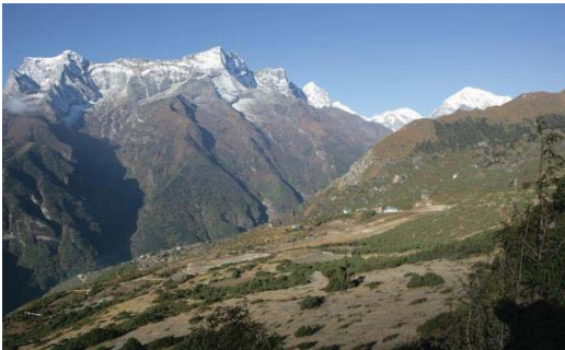
シャンボチェ飛行場跡（年間幾度も墜落するので閉鎖された^^;）標高3,800m