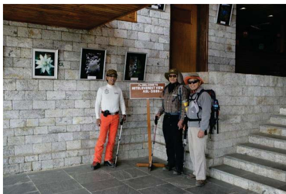
ホテルエベレストビュー 玄関 標高 3,880m