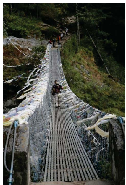
吊り橋を渡る有本先生 谷底まで約100m 誰が架設したのか？不安！（大汗！）