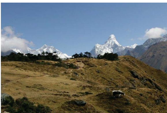
シャンボチェ 3,800m 後方右タムセルク 6,623m 左タウツェ 6,501m