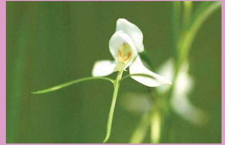
オアシソボラン科 ミソソボ属 開花期 7月～8月