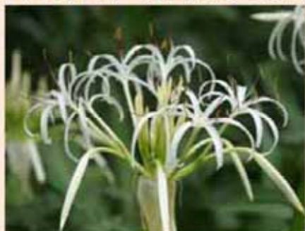
はまゆう ヒガンバナ科 多年草