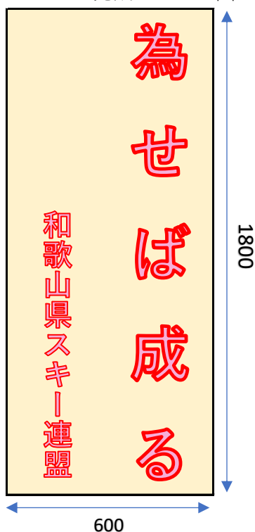
※のぼり完成イメージ図