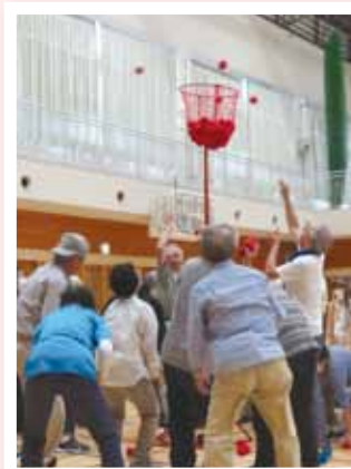
老人スポーツ大会