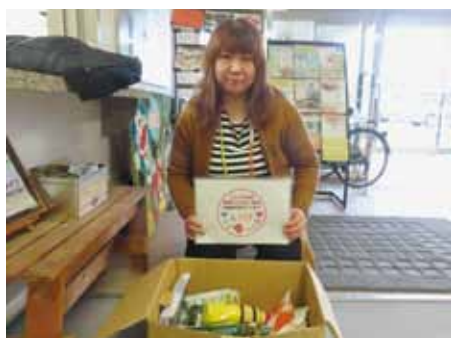
ひだまりキッチン様

先日、「わかやま市民生協」様から当会に対し、たくさんの商品をいただきましたので、その一部を町内で運営している子ども食堂(ひだまりキッチン様・ポップ食堂様)ならびに放課後学童クラブポップ様に対し、寄贈させていただいたことを報告させていただきます。