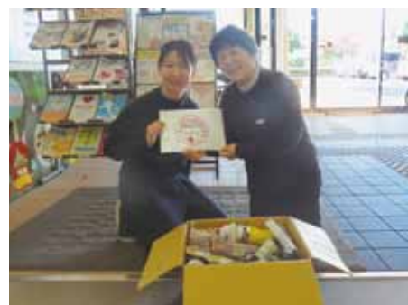
放課後学童クラブポップ様