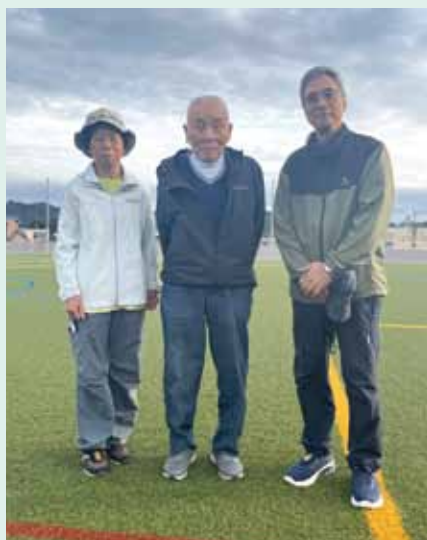
（左から）永井さん、竹中町老連会長、熊野さん（郡老連会長）