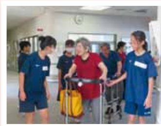
夏のボランティア体験事業