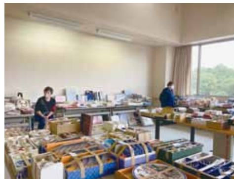
たくさんの品物が集まりました

同時に来場された皆さんから赤い羽根共同募金に7,721円の御寄附をいただきました。